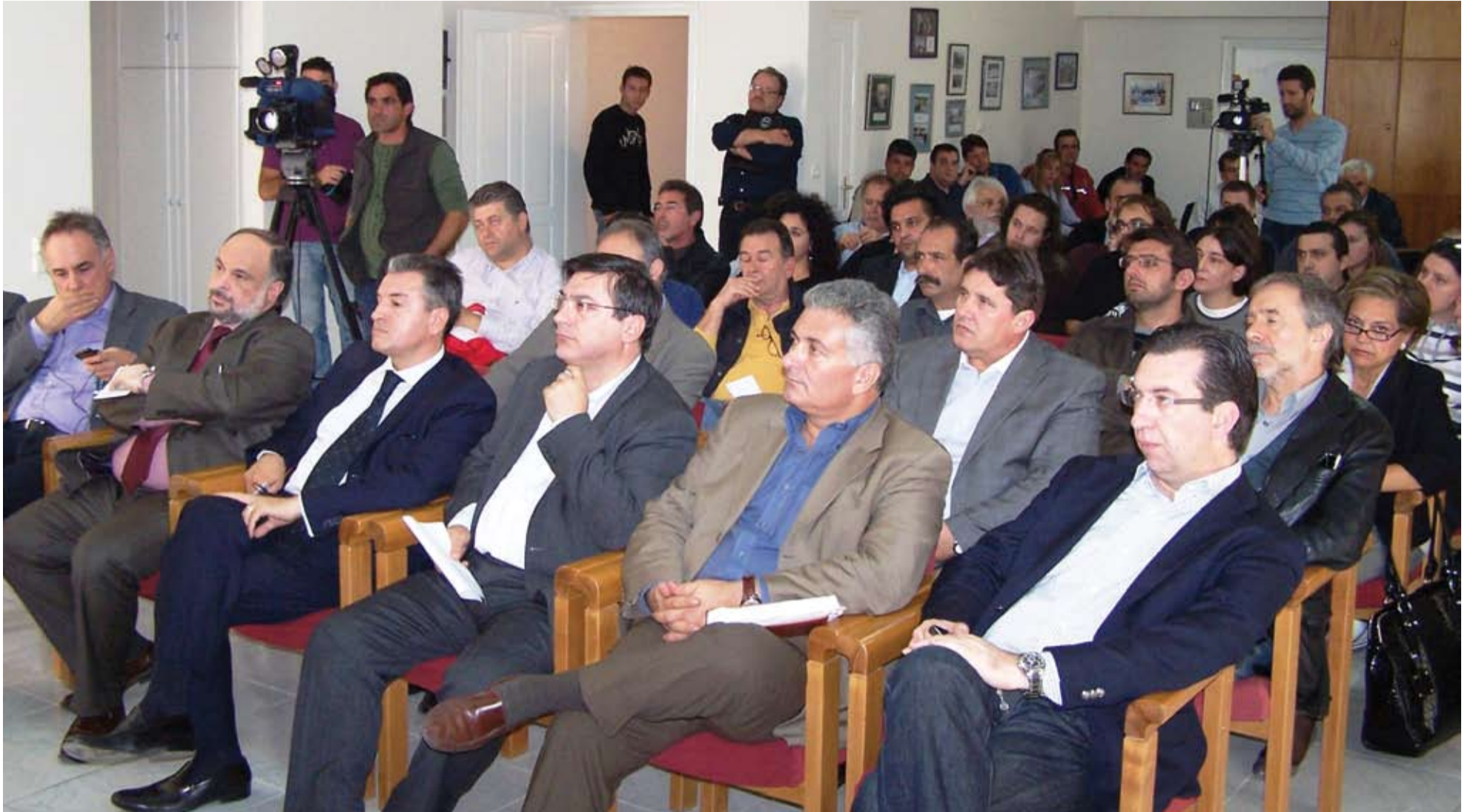
Στιγμιότυπο από τη σύσκεψη με τη συμμετοχή εκπροσώπων φορέων που πραγματοποιήθηκε στα γραφεία της ΕΣΗΕΠΗΝ