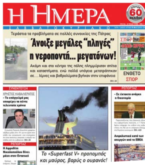
Μέχρι και την τελευταία ώρα της «Η», έκανε αποκάλυψες επιθέσεις κατά συγκεκριμένων συμφερόντων που έπλητταν το κύρος της εφημερίδας και των συνεργατών της

κυρίως στο εισπρακτικό της τμήμα, χωρίς δυστυχώς να υπολογιστεί η προσπάθεια που κατεβλήθη στο «δημιουργικό» - συντακτικό επίπεδο.