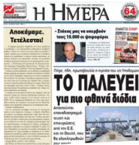
Μνημόσυνο τέλους με ξένα κόλλυβα. Ας παραδεχτούν τουλάχιστον τα στελέχη ότι άλλοι εργαζόμενοι κουράστηκαν για την αύξηση των πωλήσεων της εφημερίδας...

Η ιστορία των «κουρασμένων» στελεχών, με τις έντονες εμμονές σε προσωπικές αντιπαραθέσεις και περίπλοκες και αλυσιτελείς διαμάχες, έκανε αδύνατη την προσπάθεια επιβίωσης του εντύπου σε μια όχι και τόσο δύσκολη συγκυρία!